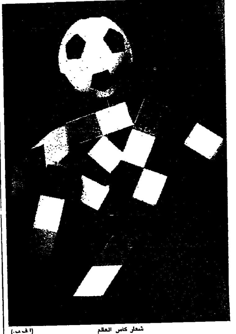
شعار كأس العالم (أ.ب.)